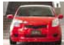
after / 装着後