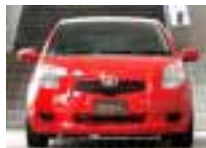
before / 装着前

■装着ホイール ■ESTATUS Style-S ML デモカー装着サイズ(デモカー用のマッチングになりますので実際の走行に使用しないで下さい) Front : 17inch-7.0J +45 Rear : 17inch-7.0J +28